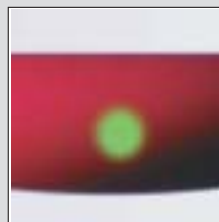
En grön lampa lyser för att bekräfta att allt är i sin ordning.

Thermia Diplomat är enastående driftsäker. Om det mot förmodan skulle uppstå problem kan den med hjälp av en GSM-modul (tilläggsutrustning) själv ringa upp ett förutbestämt mobilnummer och meddela ägare eller serviceansvarig vad som hänt. Vid ett eventuellt larmtillfälle sparas samtliga händelser så att den historiska utvecklingen kan redovisas en timme tillbaka i tiden.